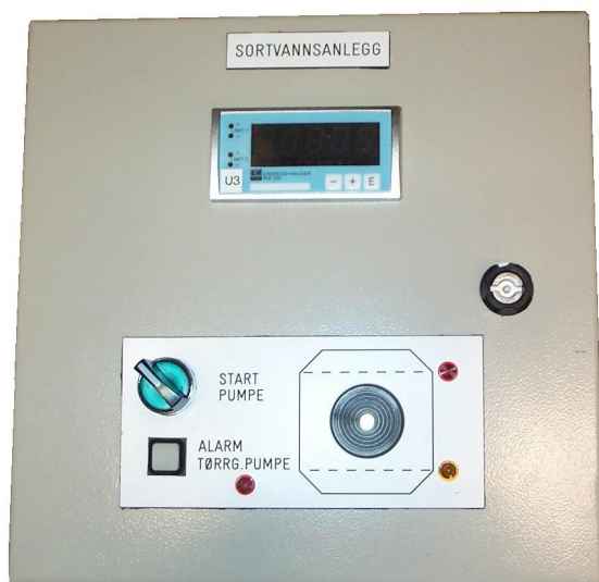
Bilde 1. Bropanel i skap

Det kan lages andre spesialtilpassninger ved behov.