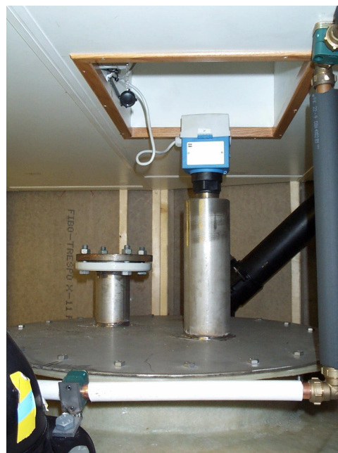
Bilde 2. Nivåsensor montert på tanktopp.